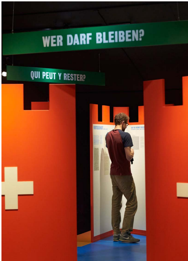
Heimat als gesellschaftspolitische Dimension. Wer darf bleiben und was gehört sich hier? Wie wollen wir zusammenleben?