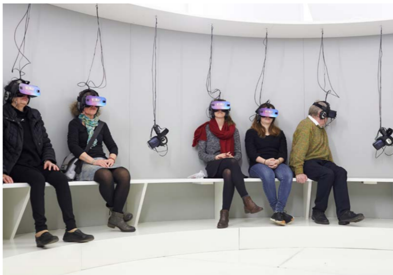
Am Ende fliegen Sie ins Weltall - und blicken zurück auf unseren Heimatplaneten.

«Heimat, von prächtiger Vielgestalt.» TAGES-ANZEIGER