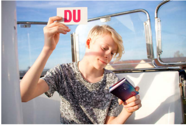
«Das Fremdeste, was man erleben kann, ist das Eigene einmal von aussen gesehen.» MAX FRISCH, SCHRIFTSTELLER