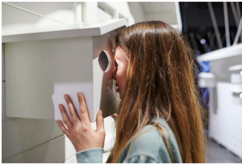
Was ist Heimat für Sie? Ein Ort oder ein Gefühl?