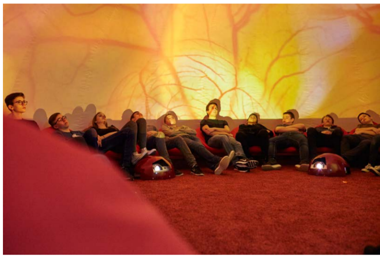
«Vielleicht ist ein Mensch nie fremder als im Moment der Geburt.» CHRISTOPH TÜRCHE, PHILOSOPH