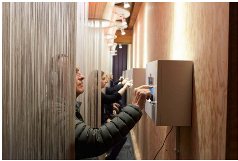
In einer Befragung erkunden Sie Ihre Heimatgefühle.