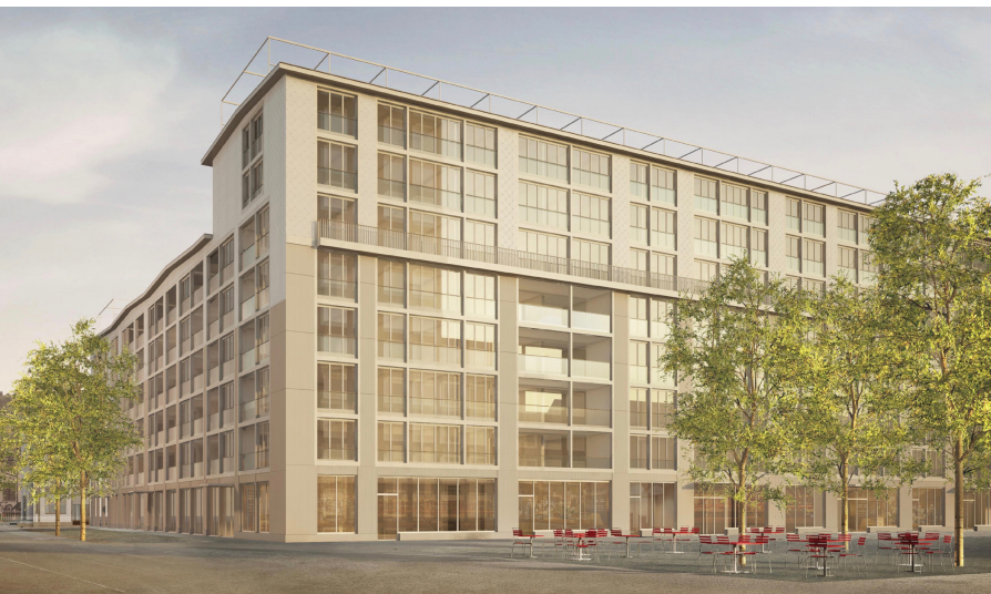
Visualisierung: Siegerprojekt, ARGE Baumberger & Stegmeier / KilgaPopp Architekten

Resultate des Studienauftrags Baufelder 3 und 5b/5c